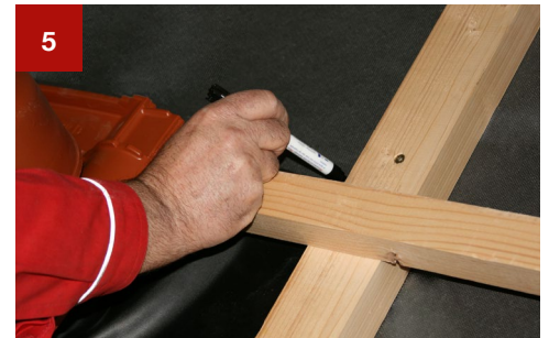
5 Anzeichnen des trapezförmigen Ausschnittes an der Unterdeckbahn.