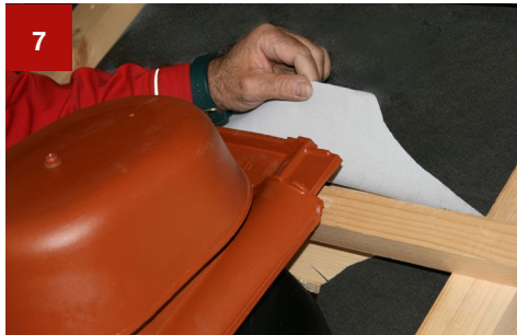
7 Unterdeckbahn hochklappen und oberen Bereich der Dichtungsmanschette unter der Unterdeckbahn positionieren und verkleben.