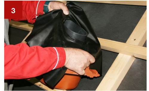
3 Überziehen der Dichtungsmanschette über das Lüftungsrohr der Grundplatte.