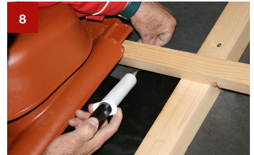
8 Anschließend die Dichtungsmanschette ausrichten und fachgerecht mit dem Manschettenkleber an die Unterdeckbahn anschließen.