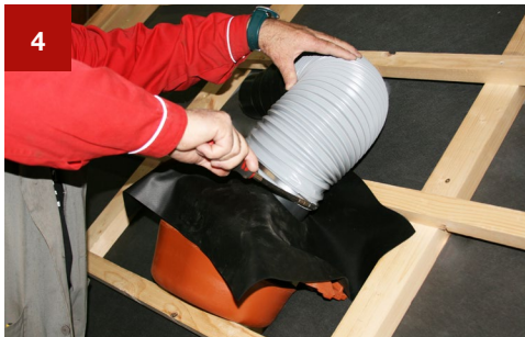
4 Anschließen des flexiblen Schlauches mit der Schelle an das Lüftungsrohr.