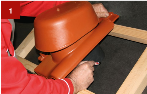
1 Kennzeichnen der Durchführungsöffnung mit Hilfe des Lüftungsrohres auf der Unterkonstruktion.