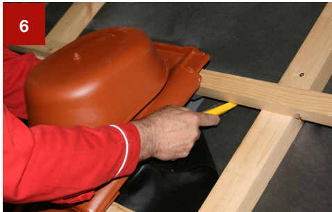
6 Anschnitt der trapezförmigen Öffnung, sodass die Unterdeckbahn nach oben aufklappbar ist.