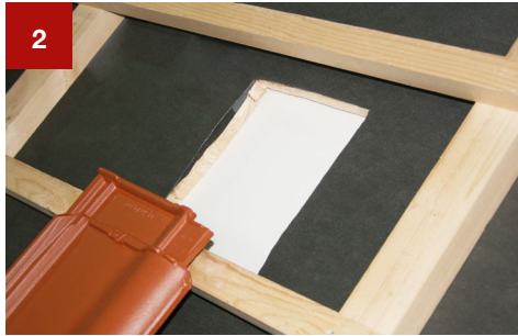
2 An der gekennzeichneten Stelle die Öffnung im Ausmaß von ca. 22x24 cm herstellen.